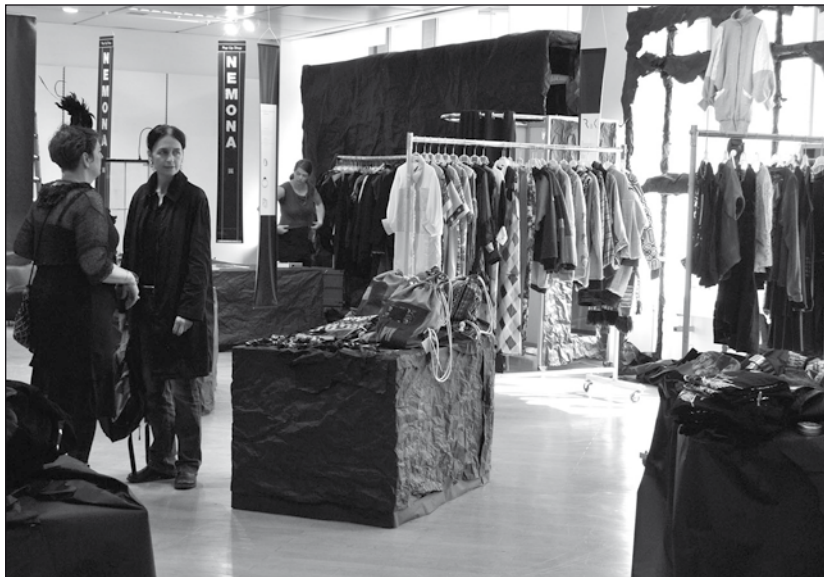
NEMONA lockte ins Erdgeschoss.

Sie lobte in ihrer Begrüßungsrede die »tolle Entwicklung in der Mode.« Das sei inzwischen zu