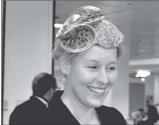
BÜRGERMEISTERIN mit Mut zum Hut.

dritten Mal bot Karstadt am Hermannplatz nun einer Reihe dieser Designer, die sich dem Neuköllner Modenetzwerk »Nemona« angeschlossen haben, die Gelegenheit,